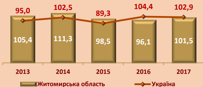
Капітальні інвестиції, млн.грн