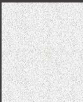
М.Авдієнко розстріляний у 1937р.