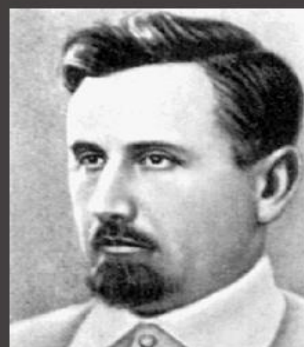
М.Кравчук загинув на засланні у 1942р.