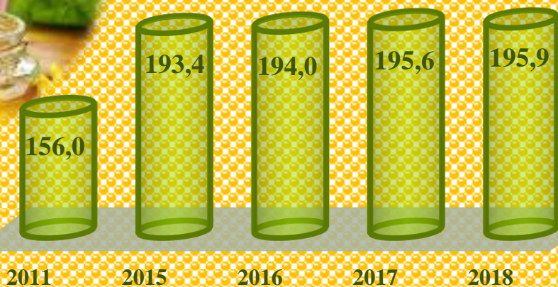
Виробництво меду в господарствах усіх категорій, (т)